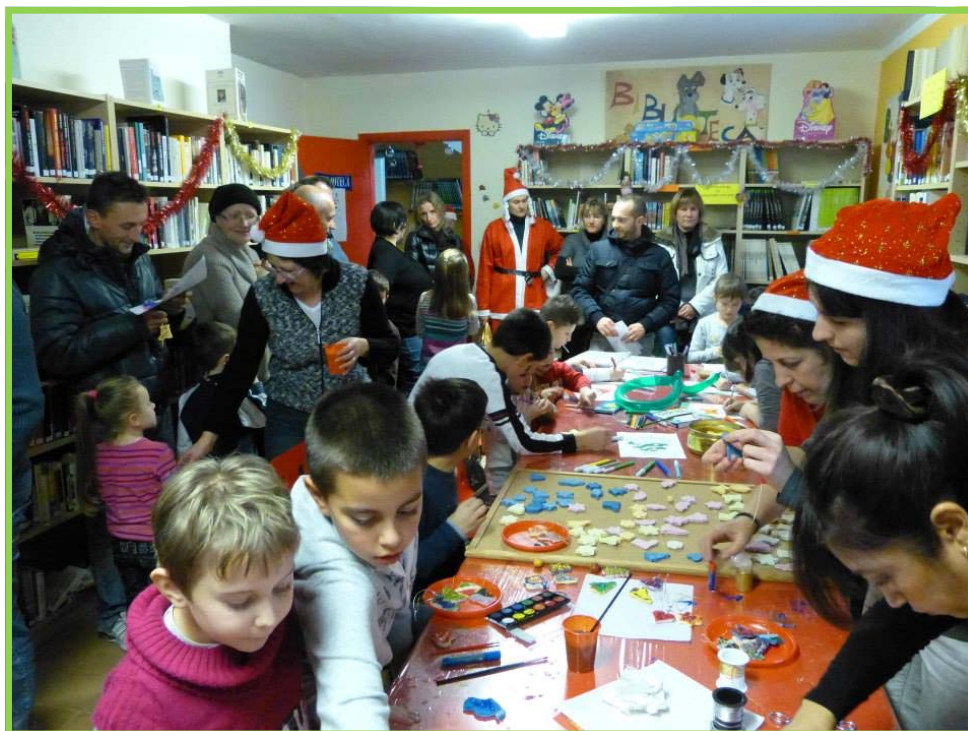
Bimbi durante la festa in biblioteca del 15 dicembre

Ogni uscita di questo editoriale sarà accompagnata da una foto che racconta un momento di vita gambaschese attuale o del passato, oppure che raffiguri un angolo caratteristico del nostro bel paese. Chiunque volesse far pubblicare una sua foto può rivolgersi alla segreteria